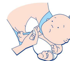
Использование при грудном вскармливании