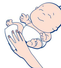
При смене подгузника