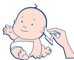
Уход за кожными складочками у младенцев