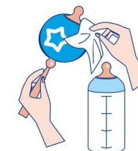
Уход за детскими аксессуарами и игрушками